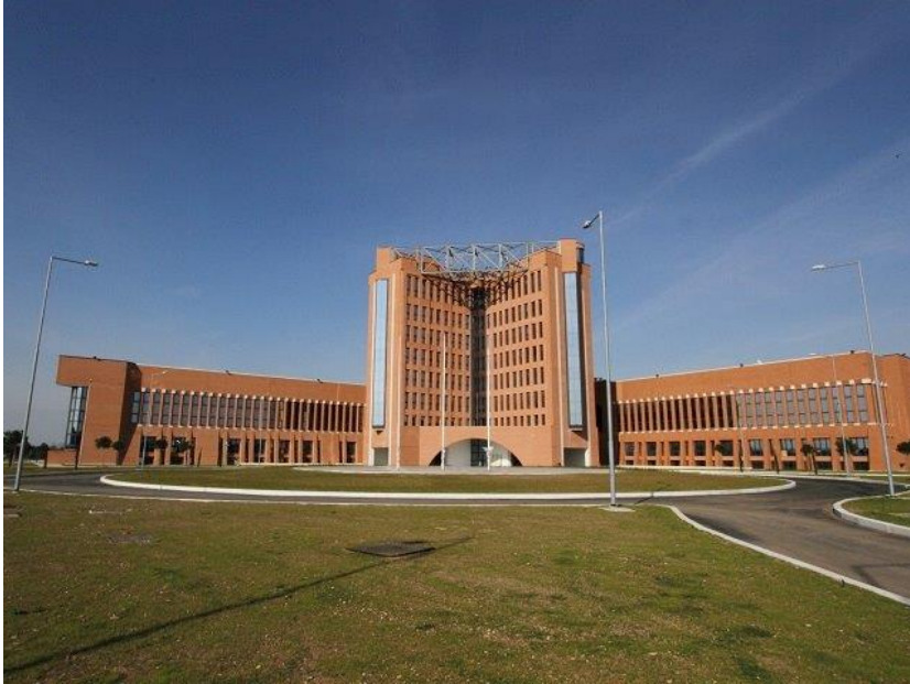
Parco Archeologico Centocelle

Stanziamenti governativi a favore del Pentagono Militare distratte dal tesoretto per la riqualificazione delle periferie. Si chiede un confronto urgente con il Presidente V Municipio, l'Assessore all'Ambiente e la sindaca Raggi